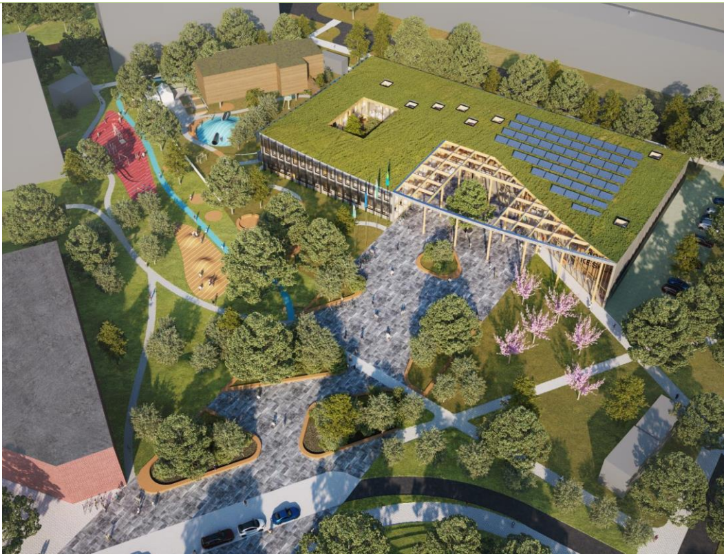
Skeem 1. Kolmemõõtmeline vaade ideekonkursi võidutööst "TANGRAM", autor Kolm Pluss Üks OÜ.

Planeeringuala kontaktvöönd on esitatud joonisel 2 ning planeeringuala olemasolevate maaüksuse andmed joonisel 3.